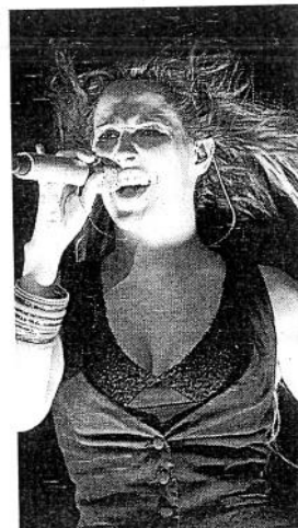
Impresión en el escenario.

Con los años, Malú se ha consolidado como una de las más impor-